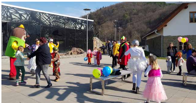
Pomurska stojnica z Olijem, virtualnimi očali in košaro za polete

Vulkanija se je konec januarja predstavljala na sejmu Alpe Adria 2020 v Ljubljani, ki je trajal štiri dni. Na stojnici Pomurja se je predstavljala skupaj z drugimi ponudniki, ki smo prostor obogatili s košaro za polet s toplozračnim balonom, pozvačinom ter našim krtkom Olijem. Pričela je tudi s promocijo za prihajajočo turistično sezono, ki pa jo je morala v marcu zaradi širitve virusa prilagoditi razmeram. Pustna sobota in torek sta letos bila med šolskimi počitnicami, zato je bilo tudi v Vulkaniji veselo. Pustovanje pri Oliju je ponujalo poslikave obraza in ples z Olijem, ki je otrokom delil balone in bonbone. Oli se je razveselil tudi obiska otrok iz vrtca OŠ Grad.