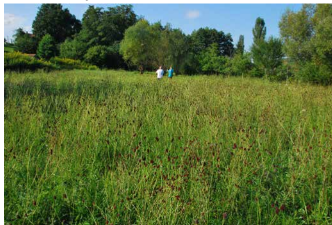
Čudovit travnik v Motovilcih po obnovi in redni košnji

poslalo 151 lastnikov kmetijskih zemljišč iz celotnega območja Natura 2000 Goričko. Od tega 23 upravičencev iz Občine Grad. Travniški visokodebelni sadovnjaki bodo v prihodnje služili kot življenjski prostor ali habitat za velikega skovika in smrdokavro. Pred zasaditvijo bomo z upravičenci opravili terenski ogled in skupaj določili število dreves za zasaditev. Z zasaditvijo se bo pričelo takoj ko bo to možno glede na trenutno situacijo v zvezi z omejevanjem širjenja virusa Covid-19.