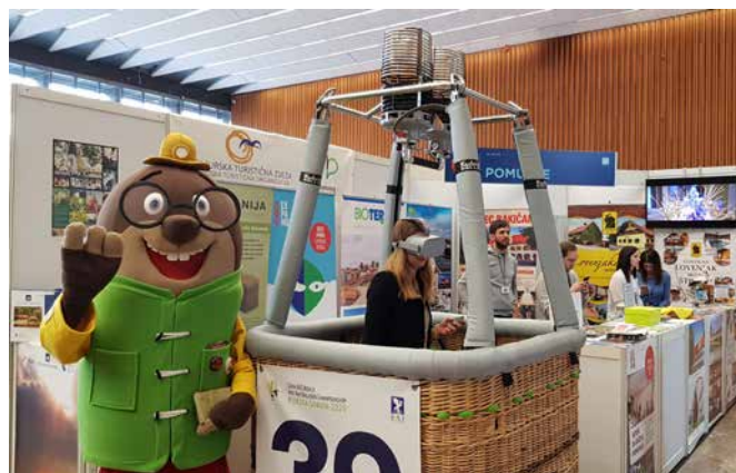
Pustno rajanje z Olijem

Poletje se je začelo optimistično, predvsem zaradi ukrepov vlade, ki je s turističnimi vavčerji pomagala turistični panogi.