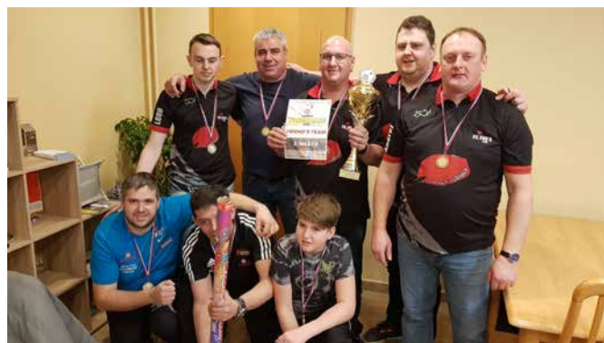
Pikado klub Friend's team

Pikado klub Friend's team je osvojil tudi prehodni pokal kot zmagovalec.