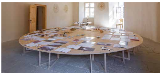
Razstava študentov arhitekture iz Ljubljane v grajski kapeli