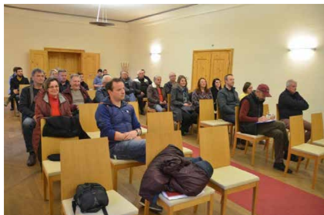
Srečanje imetnikov KBZ KPG na gradu Grad