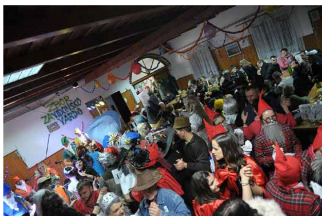
Nagrada 2. mesto

Velika zahvala pa gre predvsem seveda članom in članicam PGD Vidonci in vsem Vidončarom, saj smo za projekt žrtvovali ure, večere in celo dneve. In če ste bili z nami in s prireditvijo zadovoljni tudi vi, se nam pri maškarni v Vidoncih pridružite, upamo, spet čez sedem let.