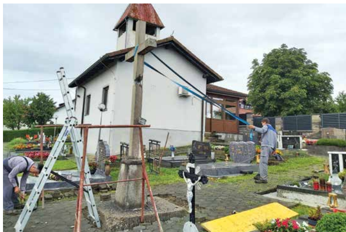
Delavci režijskega obrata so pomagali pri odstranitvi.

Na pokopališču Motovilci in Radovci sta se obnovila križa. Vrednost del v Motovilcih je bila 6.562,40 EUR, v Radovcih pa 5.610,80 EUR. Izvajalec del je bilo podjetje Kamnoseštvo Štefan Bunderla s.p. od Grada.