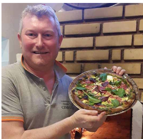
Pizza Green Cimešter že v ponudbi

Na sejnih Okusov GASTexpo 2020 se je 30. januarja 2020 odvijalo že 8. Mednarodno prvenstvo Naj picopek, ki se ga je udeležilo več kot 15 picopekov, tako ljubiteljskih kot tudi profesionalnih.