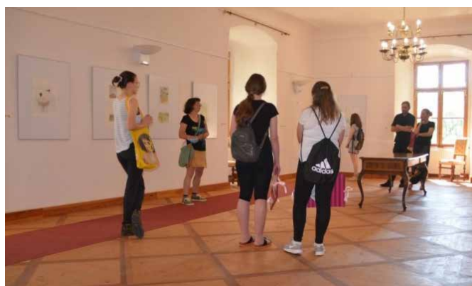
Razstava Vesne Kitthyija