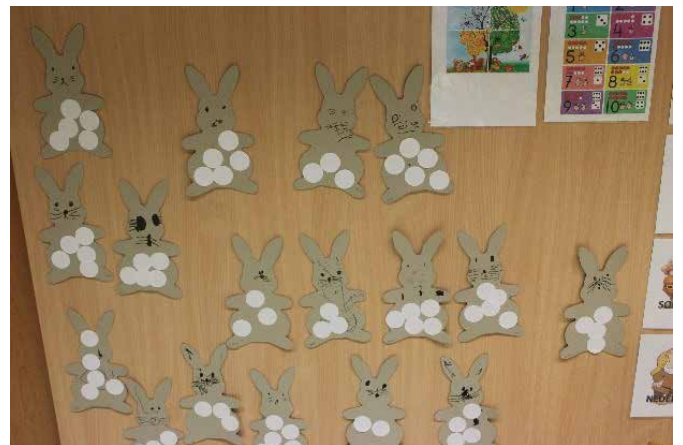
Klaudija Gomboc, vodja vrtca