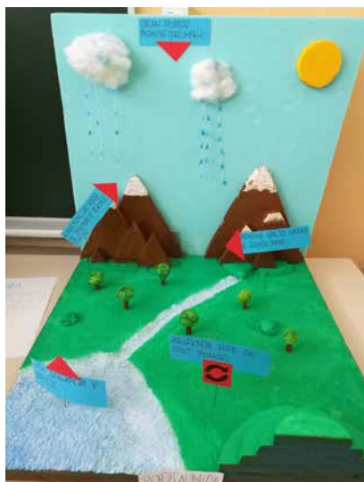
Model kroženja vode

nakupovalne vrečke in dišeče blazinice s sivko, 8. razred je iz odpadnih materialov ustvarjal rastlinske in živalske celice, v 9. razredu pa so se lotili izdelave modela kroženja vode.