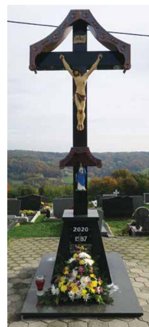
Novi križ v Motovilcih (levo) in novi križ v Radovcih (desno)