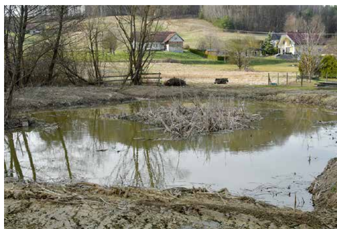
Poglobljena mlaka

Tako smo se leta 2008 skupaj z Občino Grad (ki je lastnica zemljišča) odločili, da ribnik obnovimo. Ker se je biološka stroka odločila, da rib vanj po obnovi ne bomo naseljevali, je ribnik dobil novo ime; Kačova mlaka, po zmaju Kaču.