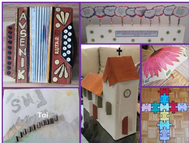
Verouk - 10 Božjih zapovedi

V tej nezavidljivi situaciji se je bilo in se je še vedno potrebno tudi nam duhovnikom/cam znajti na načine, ki so nam ostali na voljo, in izkoristiti take stvari, ki nam mogoče niso najbolj domače in morebiti tudi po godu ne. No, vedeli smo in vemo eno, da moramo biti aktivni. Še toliko bolj sedaj, ko nas ljudje v resnici potrebujejo. Seveda smo se zavedali, da se v prvi vrsti od nas pričakuje dosledno upoštevanje vseh odredb vlade in pristojnih organizacij. Z izpolnjevanjem vsega želimo biti vzgled svojim vernikom. Hkrati pa želimo pokazati, da je naše poslanstvo ostalo nespremenjeno, da smo še vedno tu za vse.