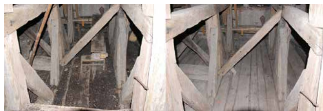
Stanje na podstrehi pred in po odstranitvi gvana