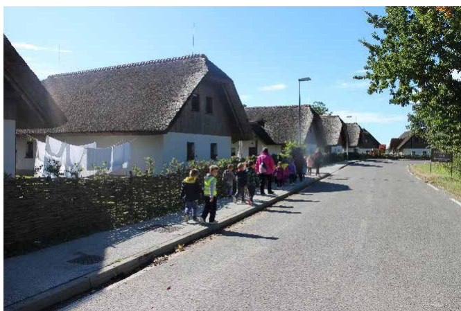
Panonska vas Tešanovci

Klaudija Gomboc, vodja vrtca