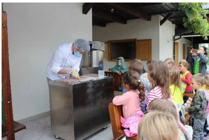
Obisk čokoladnice Passero