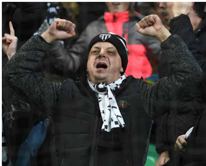
Veliki navijač Mure