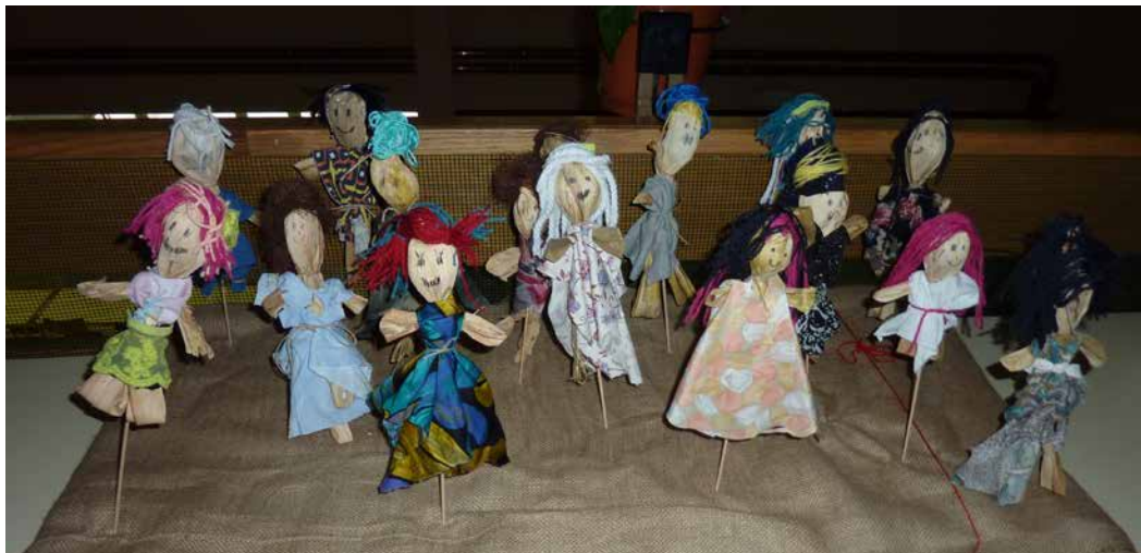
Lutke iz odpadnih in naravnih materialov

so za izdelovanje igrač uporabili koruzno ličje, v 4. razredu so poskrbeli za obvestilne table z napisi »Prepovedano odlaganje odpadkov«, učenci 5. razreda so za vsako šolsko učilnico izdelali koše za ločeno zbiranje odpadkov, učenci 6. razreda so uredili šolsko okolico in šolski vrt, v 7. razredu so iz odpadnega tekstila sešili trajnostne