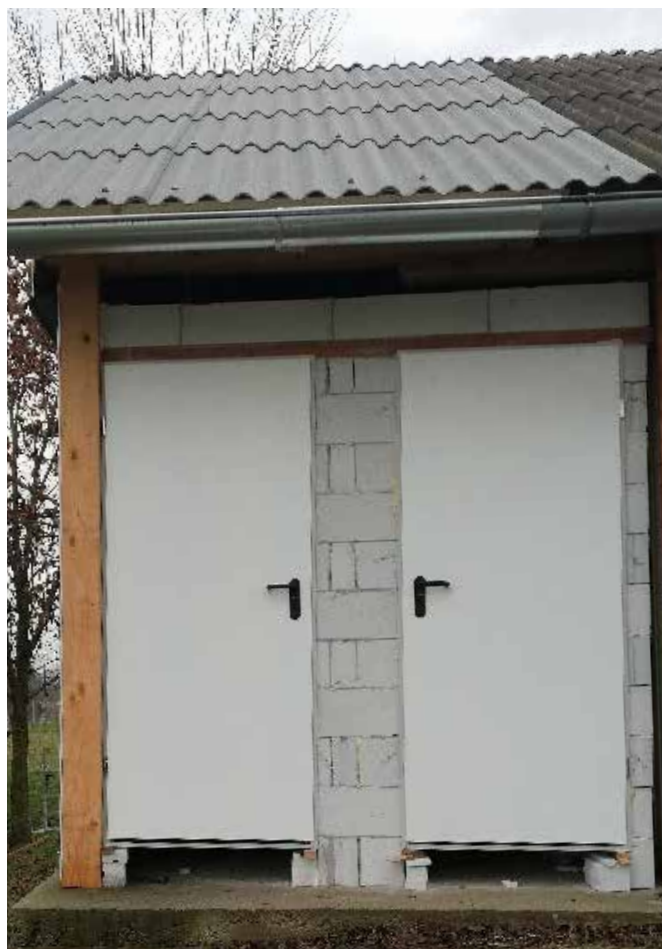
Dejan Dervarič