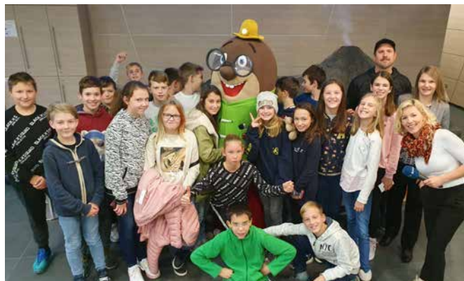
Vulkanska doživetja smo predstavili na Planet TV.

Letos smo zelo pogrešali to praznično vzdušje, ki ga zaradi epidemije nismo mogli pripraviti za vse občane in druge obiskovalce.