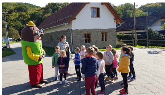
Druženje vrtčevskih otrok z Olijem v tednu otroka

V letu 2020 je Vulkanijo obiskalo 23.973 obiskovalcev. Zaradi zaprtja je obisk letos upadel za 33,42 %. Največ je