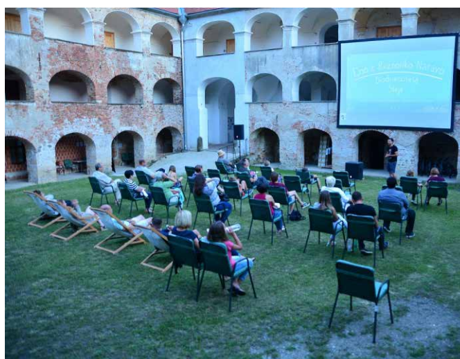
Grajski kino pod zvezdami