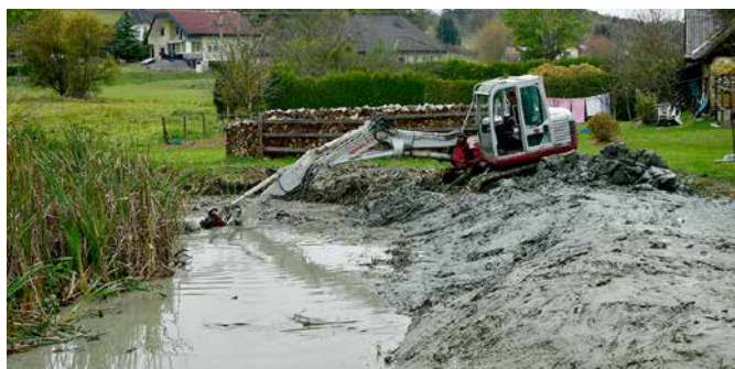
Ročno odstranjevanje zarasti 2016

Skozi desetletja, ko je bil ribnik prepuščen zaraščanju in je vse bolj kopnel, so strokovnjaki iz Zavoda za varstvo narave kljub temu v njem prepoznali velik biološki potencial, saj je bil prebivališče in pribežališče za številne ogrožene in redke vrste vodnih in obvodnih rastlin in živali ter so ga tako leta 2003 določili kot naravno vrednoto državnega pomena. Ribnik je v nadaljnjih letih vse bolj izgubljal svojo funkcijo in k temu je žal pripomoglo tudi odlaganje različnih odpadkov.