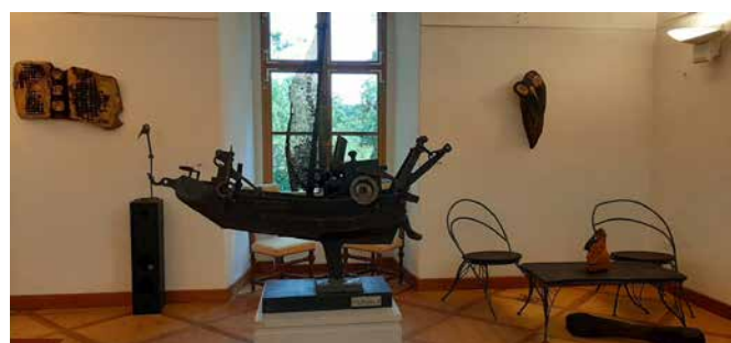
Razstava skulptur in slik Roberta Juraka