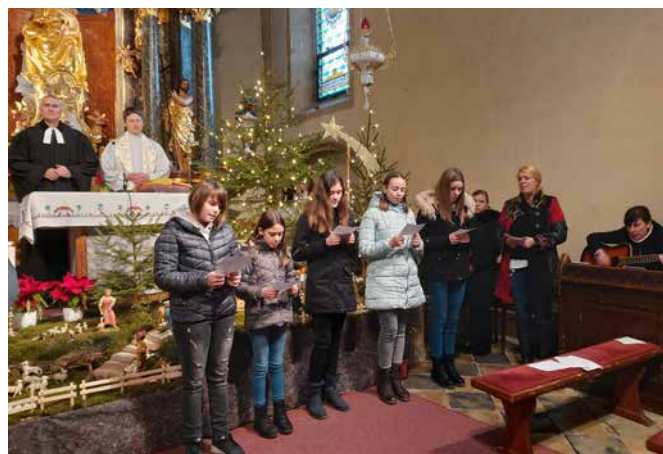
Srečanje pri Gradu