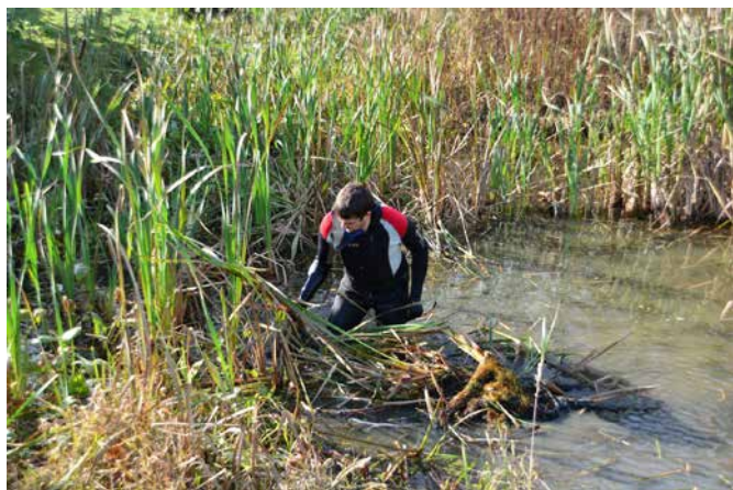
Ročno odstranjevanje zarasti 2016

Z obnovo in poglobljanjem Kačove mlake smo v Javnem zavodu Krajinski park Goričko začeli že v novembru 2019 in kar ni bilo moč dokončati takrat, smo zaključili v letošnjem marcu 2020.