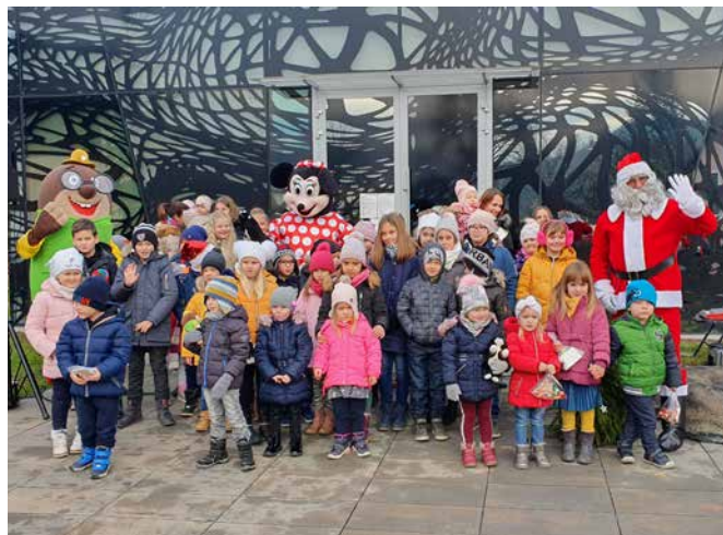
Oli in Božiček sta lani razveselila otroke.