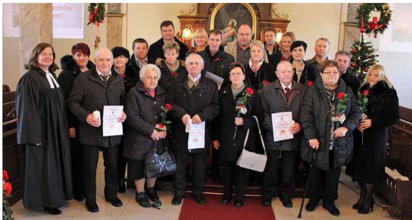
Zakonci jubilanti 2019

ga in družinskega življenja, v katerem jim vsem želimo še obilo lepih jubilejev, preživetih v zdravju, zadovoljstvu in v krogu svojih najdražjih.