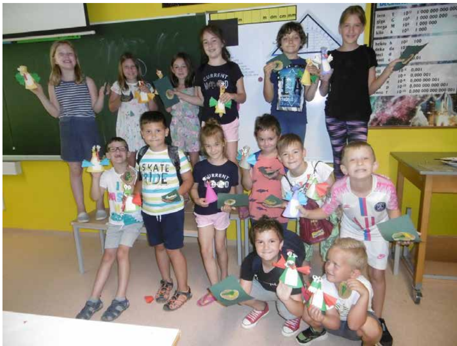
Ustvarjalne delavnice so vedno najbolj obiskane.